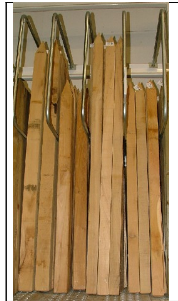
Robinie verarbeitet zu Zaunpfählen