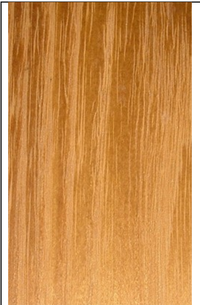
Die Robinie gehört, wie auch Esche und Eiche, zu den ringporigen Hölzern

Robinienholz trocknet langsam und neigt zum Verwerfen. Ausserdem hat Robinie eine sehr hohe Druckfestigkeit und die Elastizität ist mit der, der Esche vergleichbar.